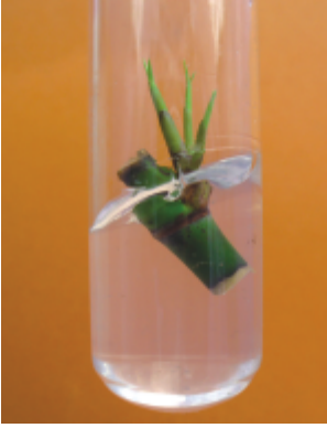
திசு வளர்ப்பு முறை