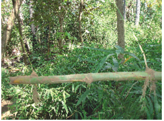
கணு நாற்று முறை