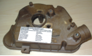
பிளாஸ்டிக் கலந்த வார்ப்பு