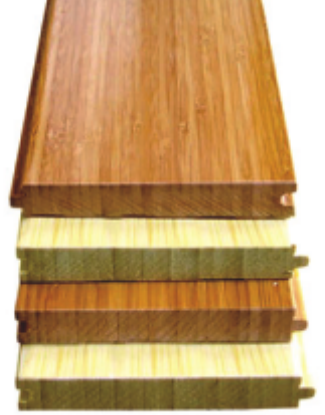
தரை தட்டு ஓடுகள்